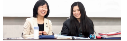
「黒染め」について話し合う原都議 2019/11/23