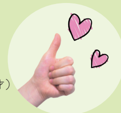
Aさん 清瀬市 (非正規で働く27才)